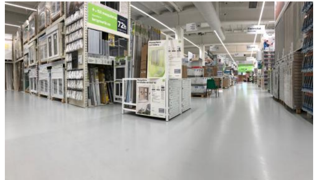
2700 m 2 de pavimento duradero

Stonhard es el líder mundial sin precedentes en la fabricación e instalación de pavimentos de alto rendimiento y sistemas poliméricos para suelos, paredes y revestimientos. Stonhard tiene 300 Territory Managers y 175 equipos de instalación en todo el mundo que trabajarán con usted en la especificación y diseño, la gestión del proyecto, la entrega final y el servicio después de la venta. La garantía de fuente única de Stonhard cubre tanto los productos como la instalación.